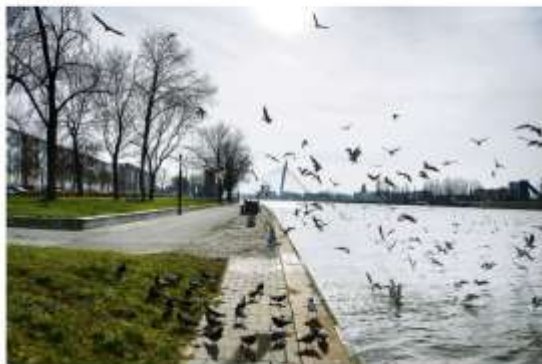
Kanaleneiland, Utrecht's mooiste (de) Tuinen. Maar er zijn achter de tuinen ook nog een andere plaag.